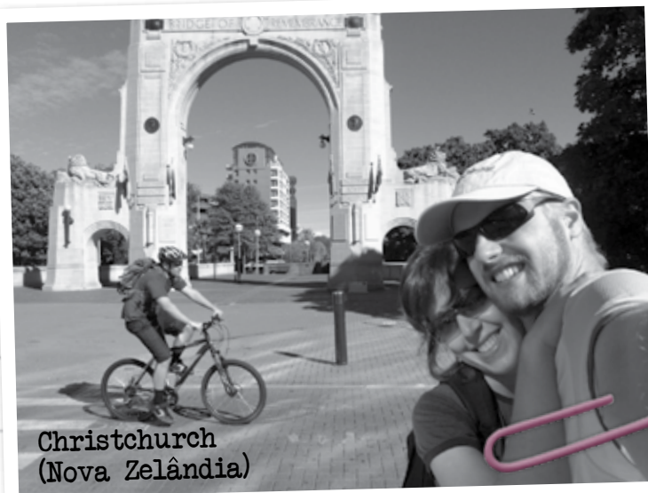
Christchurch (Nova Zelândia)