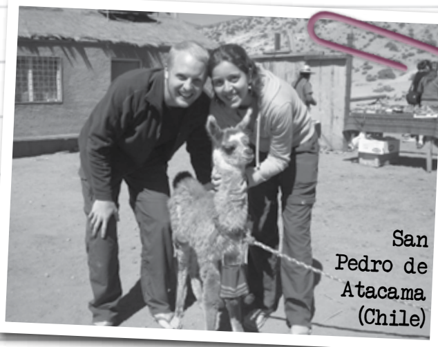
San Pedro de Atacama (Chile)

"Temos aprendido que muitas vezes ficávamos conformados e confortáveis em viver em uma espécie de aquário. Porém, percebemos que há muitas coisas acontecendo no mundo que não imaginávamos. Uma grande lição também tem sido o quanto precisamos de outras pessoas, seja para pegar um ônibus onde ninguém fala nossa língua, seja para transformar uma visão através de uma conversa em um café ou para