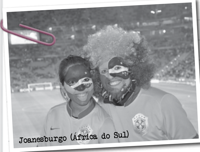
Joanesburgo (África do Sul)