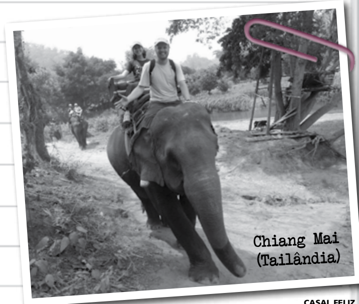
Chiang Mai (Tailândia)